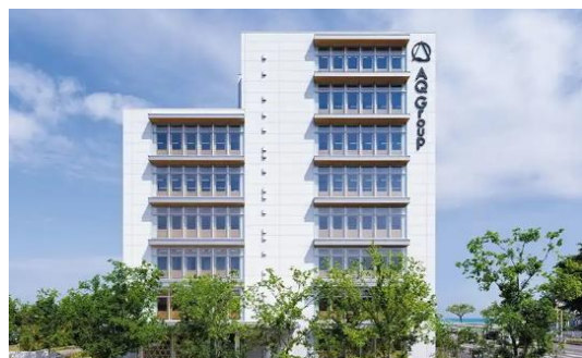
純木造8階建のAQ本社屋

弊社では、主に木造マンションを中心に、木造ビルや木造倉庫などの可能性も視野に入れ、今後の事業展開を進めてまいります。木造建築には、木ならではの温かみや、建物の印象をやわらかく見せる魅力があります。また、用途や規模によっては、工期や費用面でのメリットが期待できる場合もあります。これまで当社では、賃貸マンション、工場、倉庫、事務所など、さまざまな建物の設計・施工に携わってまいりました。今後はそこに「中大規模木造建築」という新たな選択肢を加え、より幅広いご提案ができる体制づくりを進めていきます。建築をお考えの方にとって、構造の選択肢が増えることは、計画の可能性が広がることでもあります。埼玉興産は、これからも時代の変化に対応しながら、地域に必要とされる建物づくりに取り組んでまいります。