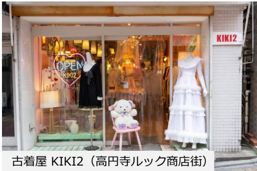
古着屋 KIKI2 (高円寺ルック商店街)